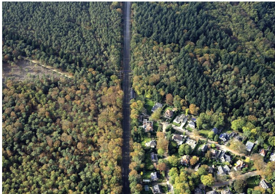
DE VAN REENENLAAN EN DE DOMLAAN KRUISEN DE SPOORLIJN, MET DE VOETBRUG DOMLAN ALS VERBINDING OVER HET SPOOR

gebruikt en er loopt een aantal Lange Afstand Wandelroutes door. Waaronder het Trekvogelpad LAW-2, dat al meerdere malen is verlegd door het opheffen van spoorwegovergangen.