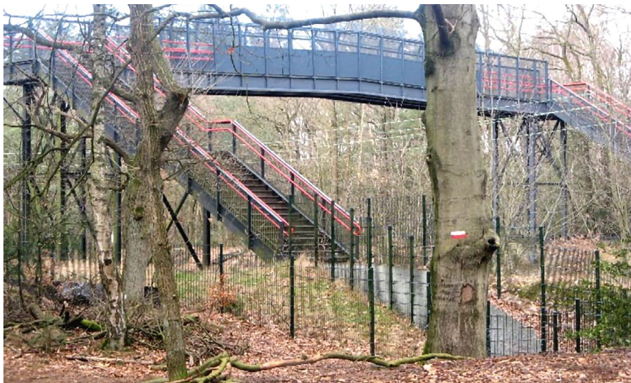
VOETBRUG ZICHTBAAR VANAF HET WANDELPAD TEN ZUIDEN VAN HET SPOOR

Door de recreatieve waarde van het gebied is de spoorwegovergang van groot belang en een onmisbare schakel in het recreatieve netwerk. Daarnaast heeft de brug een zeer beperkt ruimtebeslag waardoor de aantasting van de natuurwaarden in het gebied tot een minimum zijn beperkt.