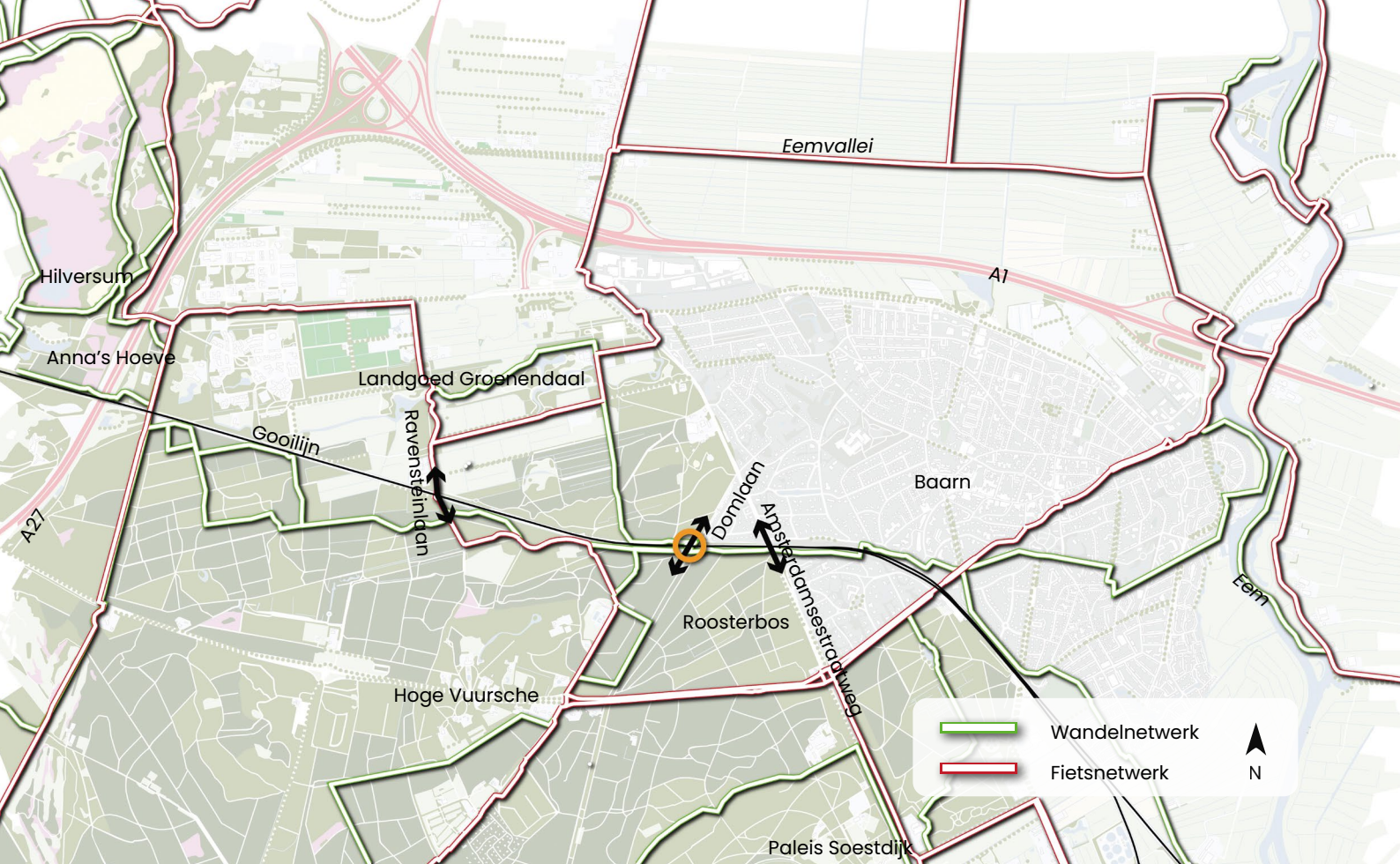
ROUTENETWERK RONDOM OVERGANG VOETBRUG DOMLAAN