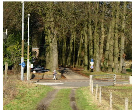
AANZICHT INGANG MARIËNDAAL VANUIT HET WANDELPAD TEN ZUIDEN VAN DE N225

De middengeleider in de Utrechtseweg bij landgoed Mariëndaal is een goed voorbeeld van een simpele ingreep die de barrièrewerking van een weg sterk vermindert en de verkeersveiligheid vergroot. De locatie van deze kruising in het laatste stuk open landschap tussen Arnhem en Oosterbeek, maakt dit tot een zeer waardevolle toevoeging in de recreatieve verbindingen tussen Veluwe en Neder-Rijn, zoals het Limespad en het Maarten van Rossumpad.