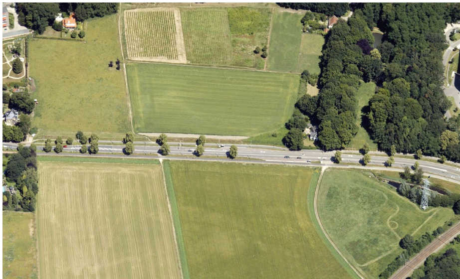
AANZICHT VAN DE UTRECHTSEWEG N225 VANUIT HET ZUIDEN MET LINKS EEN KLOMPENPAD ZONDER OVERSTEEK MET MIDDENGELEIDER EN RECHTS DE OVERSTEEK MET MIDDENGELEIDER

werking van de weg toegenomen. Tegenwoordig is het een N-weg waar met een snelheid van 60 km/u gereden wordt. Naast twee rijstroken, is er ook een busbaan toegevoegd. Aan beide zijden van de weg ligt een vrij liggend fietspad met een wandelstrook, maar de ingerichte oversteekmogelijkheden zijn beperkt.