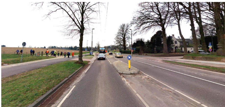
DE MIDDENGELEIDERS