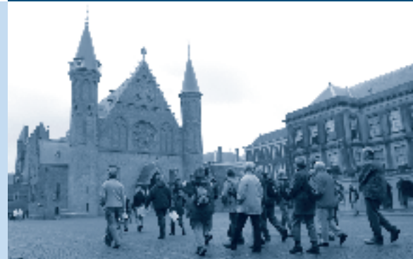
Stadswandeling door Den Haag, tijdens de Medewerkersdag

Het als vrijwilliger meehelpen is één manier om de Stichting te ondersteunen. Een andere manier van steun uitbrengen is door het storten van een donatie. Hiermee word je ‘Vriend of Vriendin van de Stichting’. Een ‘Vriend(in)’ ontvangt vier keer per jaar de nieuwsbrief Lopende Zaken en krijgt automatisch de nieuwste folder