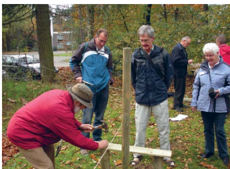
Medewerkers in actie tijdens de verschillende workshops