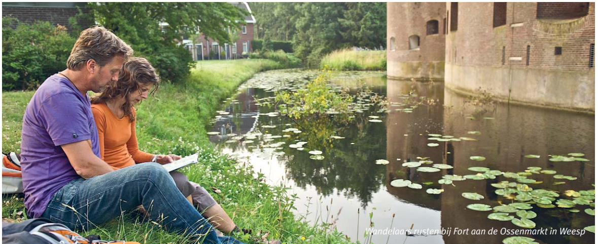
Wandelaars rusten bij Fort aan de Ossenmarkt in Weesp