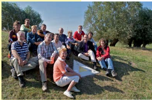
De padwerkgroep van het streekpad Stelling van Amsterdam

De provincie Noord-Holland, Recreatie Noord-Holland NV en Stichting Wandelplatform-LAW tekenden in 2007 een intentieovereenkomst voor het ontwikkelen van een doorgaande wandelroute Stelling van Amsterdam. De afgelopen twee jaar is hieraan hard gewerkt. En met succes, de doorgaande wandelroute plus een fraaie wandelgids zijn klaar!