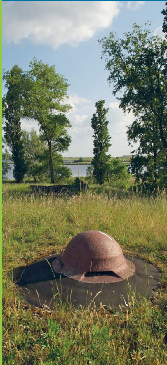
Fort bezuiden Spaarndam met geschutskoepel

Wie wil weten hoe een UNESCO-monument eruit ziet, komt aan de westflank van de Stelling van Amsterdam volledig aan zijn trekken. Met de gloednieuwe wandelgids van de Stelling in de hand - beginnende bij kaart 9 - ziet u na pakweg 2 km Fort aan den Ham al opduiken. Dit fort moest de naastgelegen spoorlijn verdedigen. Maar, de Stelling is meer dan een verzameling forten. Het bestaat ook uit kanalen, sluizen en aanvoerwegen. En zo komt u via de Genieweg bij Fort bij Veldhuis. Dit is een van de oudste forten en nog in originele staat! Het pad op de zogenoemde nevenbatterij biedt een mooi zicht op de defensieve krachten van het fort. Daarna verlaten we even de Stelling en passeren het machtige Noordzeekanaal. Pardoes beland u op het golfterrein Spaarnwoude, waar het vrij wandelen is. Via 'zijkanaal B' komt u in Spaarndam. Hier kunt u de bus nemen. Wilt u uw wandeling nog vervolgen, dan loopt u verder via Fort bij de Liebrug naar station Spaarnwoude.